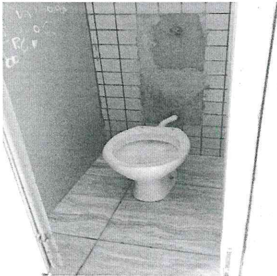
3. Não há ligação hidráulica e válvula de descarga .