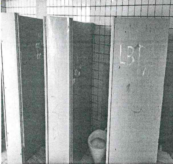
1. Vista do banheiro.