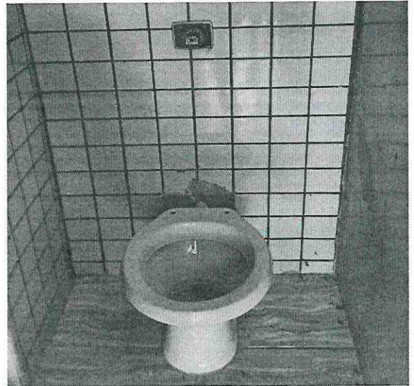
2. Não há ligação hidráulica e válvula de descarga .