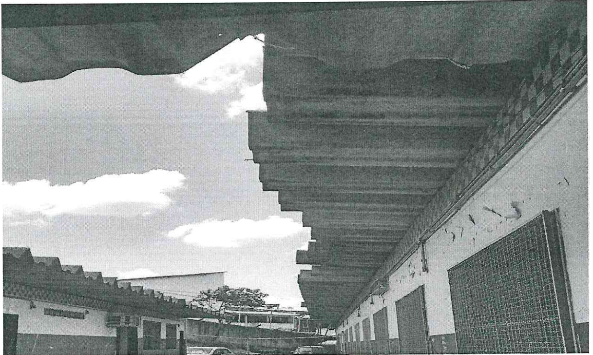
1. Vista do telhado – telhas deslocadas.