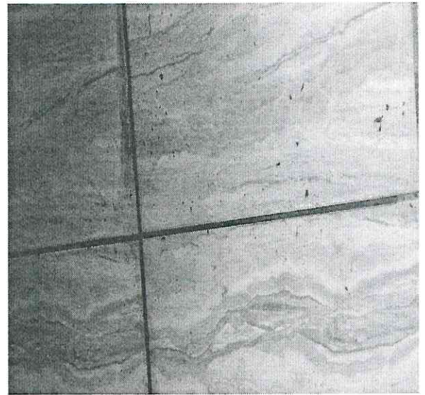
4. Desnível no piso do banheiro – ponto de acúmulo de água.