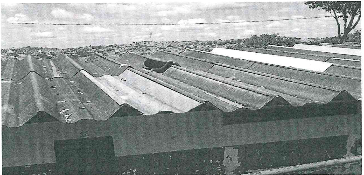
2. Abertura no telhado – ponto de entrada de água e infiltração no teto.